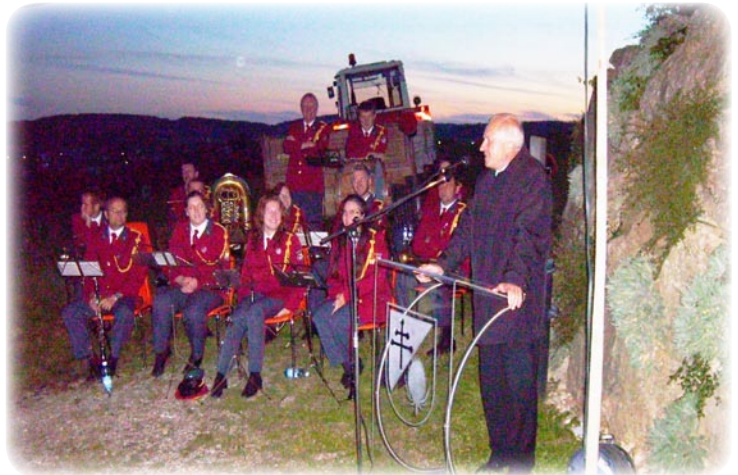
LH-Stv. Franz Hiesl während der Festansprache

Am 6. September 2010 wurde der neu errichtete Gehsteig samt energiesparender LED-Beleuchtung in Bodendorf eröffnet und wurde so offiziell seiner Bestimmung übergeben. Als Ehrengast wurde LH Stv. Franz Hiesl begrüßt. Eine Abordnung des Katsdorfer Musikvereines umrahmte die Eröffnungsfeier musikalisch. Die zahlreich erschienen Katsdorferinnen und Katsdorfer wurden mit frisch gedörretem Obst vom Heimatverein verwöhnt sowie auf Würstl und Getränke von der Gemeinde eingeladen. Für die Flutopfer in Pakistan wurden so Spenden in Höhe von € 157,40 gesammelt, welche durch einen einstimmigen Beschluss des Gemeindevorstandes auf € 250,- erhöht wurden. Mit der Errichtung dieses Gehsteiges konnte somit ein weiterer Schritt zur Verkehrssicherheit, vor allem der Bodendorferinnen und Bodendorfer beigetragen werden.